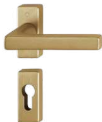
F78-1-R natural- brass-coloured satin