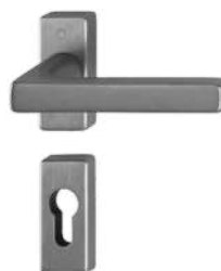
F97-1-R satin anthracite