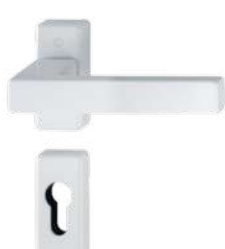
F9016 traffic white