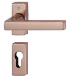
F84-R copper-coloured polished