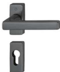
iF96-R polished black