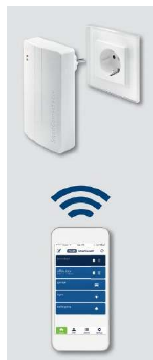
ukse ülevaade ja juhtimine telefonist