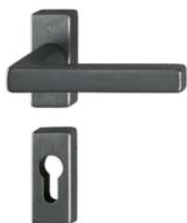
iF96-1-R satin black