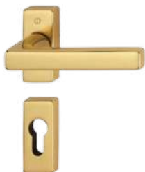
F78-R natural-brass -coloured polished