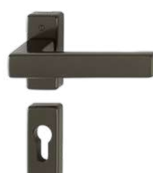
F8707 dark brown