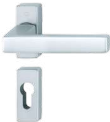
F1 aluminium Silver