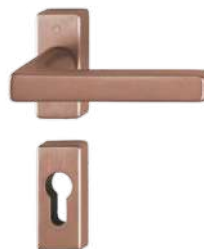
F84-1-R copper- coloured satin